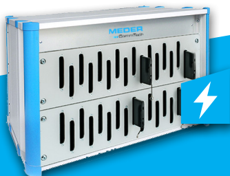
Tischladestation Geeignet für bis zu 40 Geräte Erhältlich für alle Gerätetypen